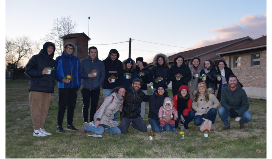
I ragazzi di III e IV superiore dell'Unità Pastorale

In questi luoghi abbiamo toccato con mano la crudeltà e l'odio che privarono molti uomini, in particolare ebrei ed oppositori politici della loro libertà, condannandoli a morte. Ci siamo chiesti: che cos'è la pace? Troppo volte, ancora oggi, viviamo nell'odio, nella violenza e nell'oppressione: abbiamo invocato la pace e reso omaggio a questi luoghi con una piccola primula colorata, testimoniando che la vita e l'amore possano vincere sull'odio e l'egoismo umano. Nella visita ci hanno accompagnato la Parola di Dio e alcuni scritti di Primo Levi , che nel 1943, prima di essere deportato ad Auschwitz, passò dal campo di Fossoli. Vorremmo salutarvi con le sue parole: "Per quanto di senso può avere il voler precisare le cause per cui proprio la mia vita, fra migliaia di altre equivalenti, ha potuto reggere alla prova, io credo che proprio a Lorenzo debbo di essere vivo oggi; e non tanto per il suo materiale, quanto per avermi costantemente rammentato, con la sua presenza, con il suo modo così piano e facile di essere buono, che ancora esisteva un mondo giusto al di fuori del nostro, qualcosa e qualcuno di ancora puro e intero, di non corrotto e non selvaggio, estraneo all'odio e alla paura; qualcosa di assai mal definibile, una remota possibilità di bene, per cui tuttavia metteva conto di conservarsi. [...] Grazie a Lorenzo mi è accaduto di non dimenticare di essere io stesso un uomo."